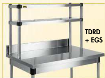
TDRD + EGS