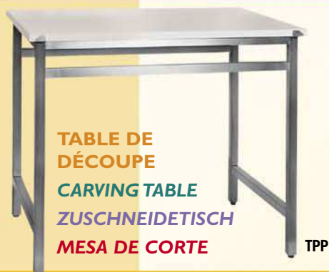
TABLE DE DÉCOUPE CARVING TABLE ZUSCHNEIDETISCH MESA DE CORTE