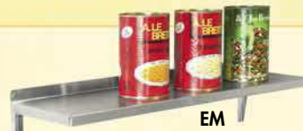
ETAGÈRES MURALES WALL SHELVES WANDREGALE ESTANTERIAS MURALES

Pleines ou à claires Solid or grid Massiv oder offen Fijas y fijas de tubo