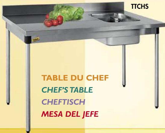
TABLE DU CHEF CHEF'S TABLE CHEFTISCH MESA DEL JEFE

TOUTES NOS TABLES SONT PROPOSÉES SUR VÉRINS OU SUR ROULETTES POLYAMIDE ALL TABLES WITH JACKS OR POLYAMID WHEELS