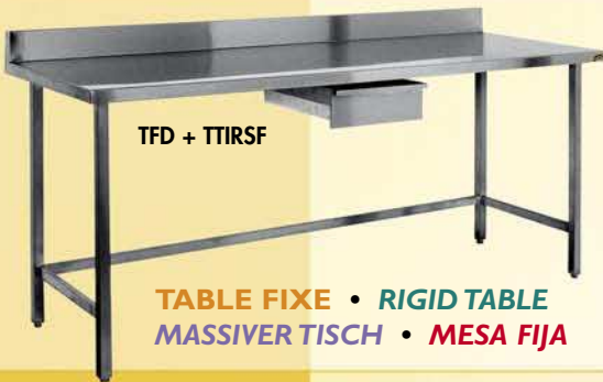
TABLE FIXE • RIGID TABLE MASSIVER TISCH • MESA FIJA