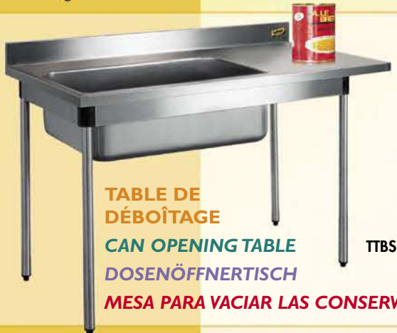
TABLE DE DÉBOÎTAGE CAN OPENING TABLE DOSENÖFFNERTISCH MESA PARA VACIAR LAS CONSERVAS