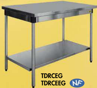
TDRCEG TDRCEE NF